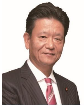
三ッ林 裕巳 衆議院議員

日本大学医学部卒業。1992年医学博士取得。2011年3月・自由民主党埼玉県第十四選挙区支部長。2012年12月・衆議院総選挙にて初当選、2014年12月・第47回衆議院総選挙当選、現在2期目。第3次安倍改造内閣で厚生労働大臣政務官（2015年10月～2016年8月）。現在、衆議院厚生労働委員会理事、自民党内閣第一部会副部会長、自民党厚生労働部会副部会長、日本大学医学部教授、日本歯科大学生命歯学部教授、日本歯科大学付属病院副院長。