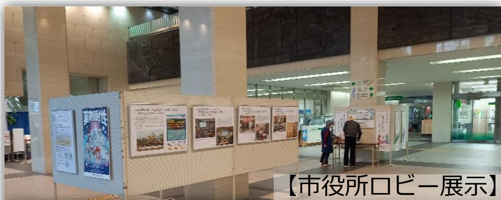
【市役所ロビー展示】