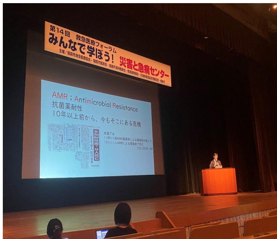
【救急医療フォーラムでの講演】