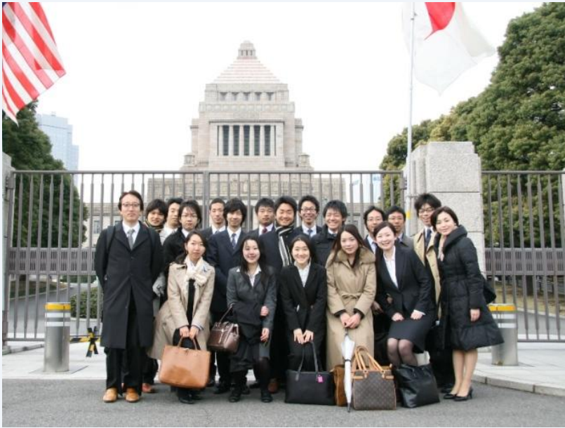
記念撮影 (国会議事堂前にて)