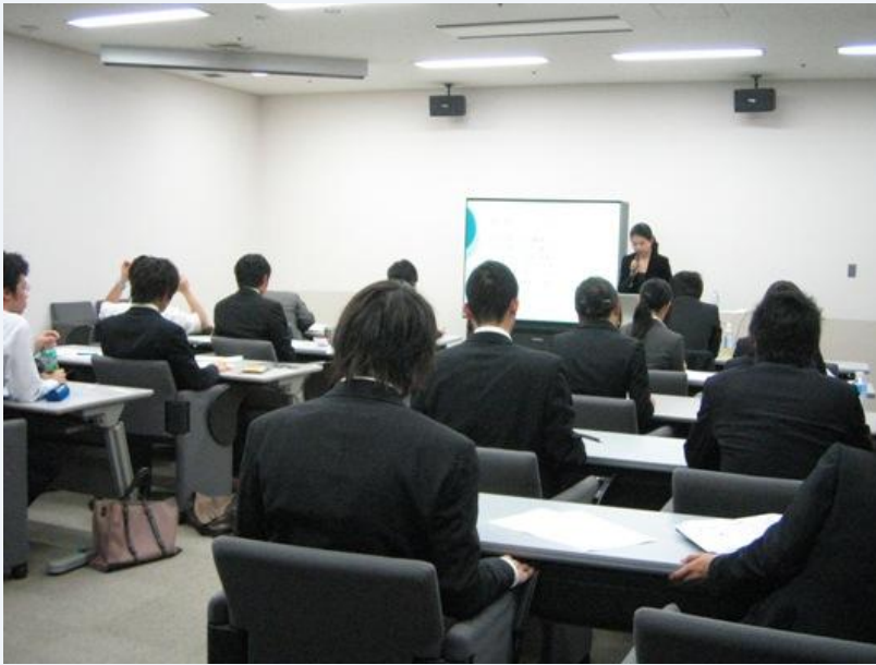
東大病院における 講義風景