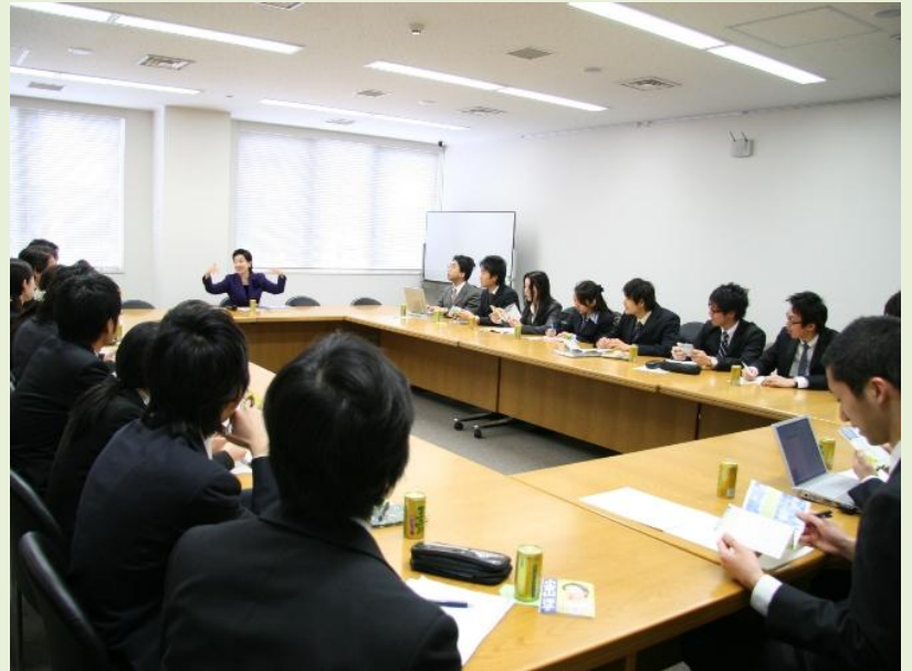
小宮山洋子衆議院 議員ヒアリング