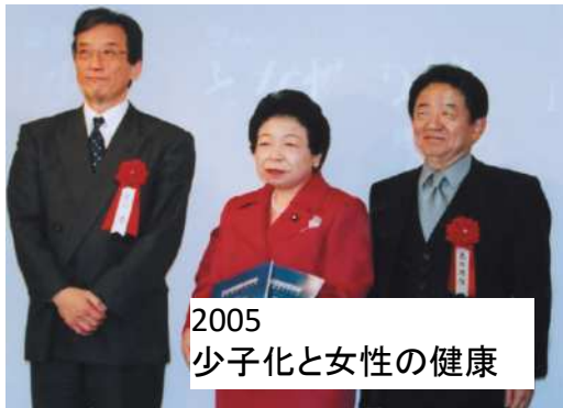
2005 少子化と女性の健康