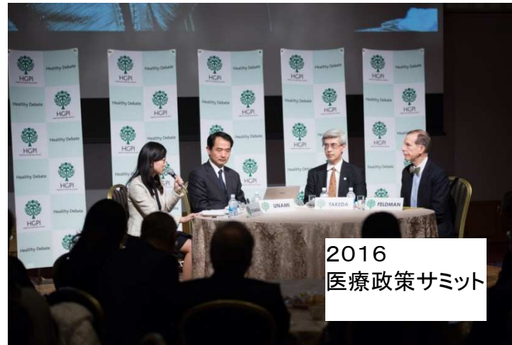
2016 医療政策サミット