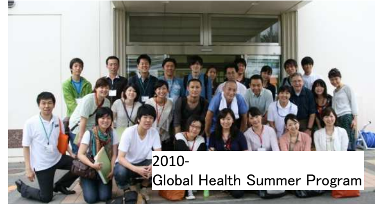
2010- Global Health Summer Program