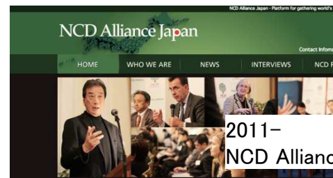
2011- NCD Alliance Japan