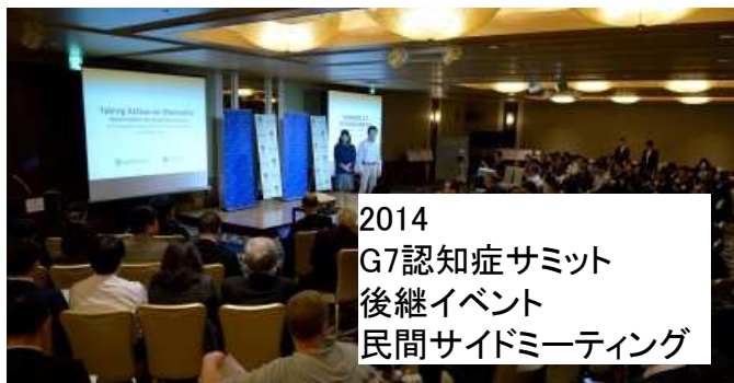
2014 G7認知症サミット 後継イベント 民間サイドミーティング