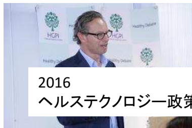
2016 ヘルステクノロジー政策