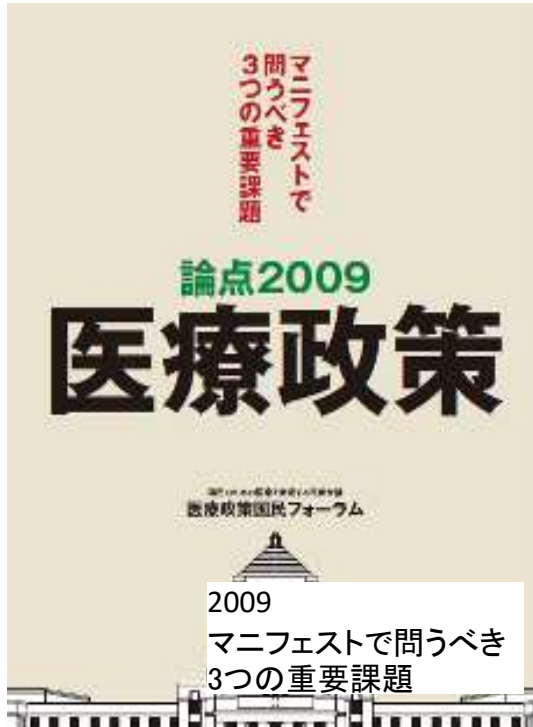
2009 マニフェストで問うべき 3つの重要課題