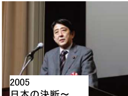
2005 日本の決断～ 国民が真に求める 医療政策とは