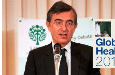
Global Health Forum 2011 The MDGs and Beyond "Beyond 2015"