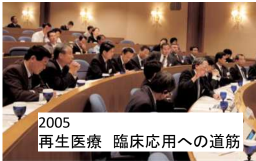
2005 再生医療 臨床応用への道筋