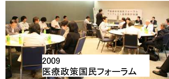
2009 医療政策国民フォーラム